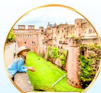
Lâu đài Heidelberg